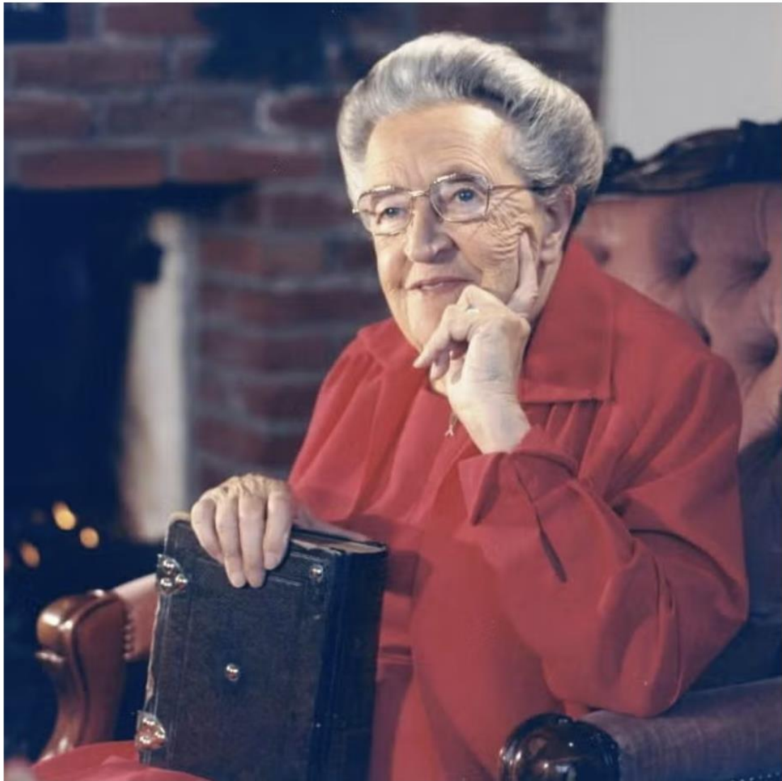
The Corrie Ten Boom House Foundation